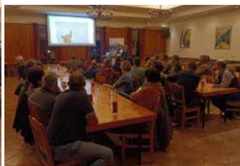
Regel Beteilung bei den Ortsteilgesprächen