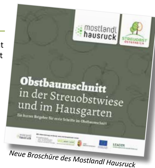
Neue Broschüre des Mostlandl Hausruck