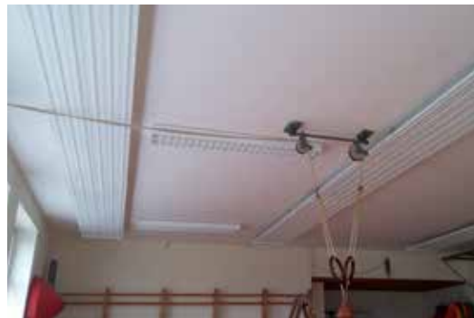
Im Turnsaal wurde eine Deckenheizung eingebaut

So wurde in der Volksschule der Umbau der Heizung mit der Installation im Turnsaal abgeschlossen.