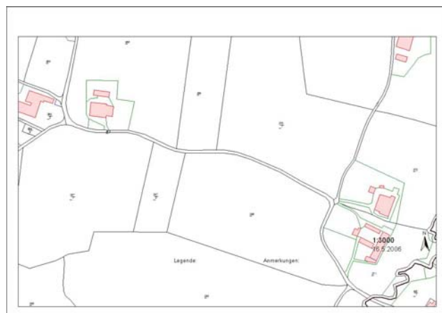
Dieser Bereich nach dem Ausbau Weikinger-Berg bis Schömlahn sollte saniert werden.

Geplant ist heuer die Herstellung des Unterbaues mit den Entwässerungen und im nächsten Jahr die Asphaltierung.