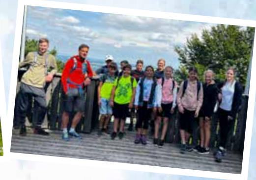
Gummistiefelwanderung der Goldhaubengruppe