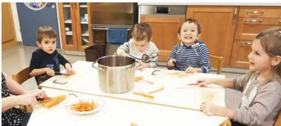
Einmal pro Woche wird mit den Kindern eine gesunde Jause zubereitet.

Einmal pro Woche wird mit den Kindern eine gesunde Jause zubereitet. Saisonale Suppen, Aufstriche und Brote finden bei den Kindern viel Anklang, genauso wie Joghurt mit Früchten, Müsli oder frisch gepresste Säfte. Und selbstverständlich schmeckt Selbstgekohtes viel besser.