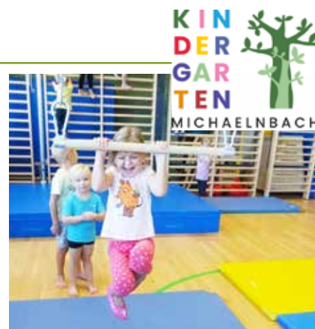
Ausreichend Bewegung im Turnsaal und im Freien ist ein besonderer Schwerpunkt.

Unterstützung der Gemeinde Michaelnbach und des Landes Oö. stattfinden. Mit dem Dino Spaß mit Spielen und Übungen wird nicht nur die Freude an der Bewegung geweckt, die Kinder lernen auch einiges über ihren Körper und die richtige Haltung.